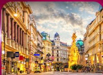
ชมเมืองโรมันติก เวียนนา