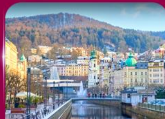
เมืองสปาแสนสวย คาร์โลวี วารี