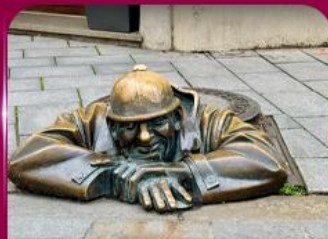
เซลฟี่คูคูมิลา บราติสลาวา