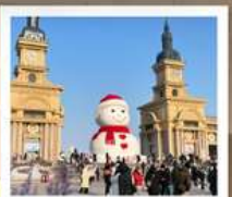
ตึกตาคีเย-ยักซ์