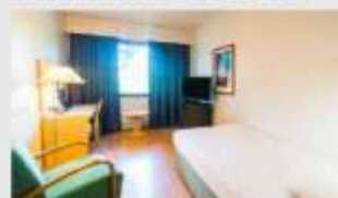
Single สำหรับ 1 ท่าน