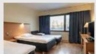
Triple สำหรับ 3 ท่าน