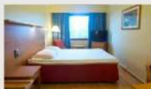
Double สำหรับ 2 ท่าน