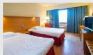
Twin สำหรับ 2 ท่าน