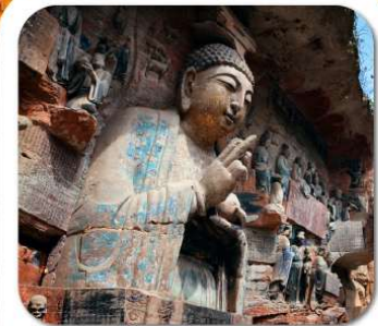
"พาสินแกะสลักต้าจู้"