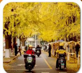
"ถนนแปะก๊วย"

นั่งกระเช้าชมภูเขาหวงอู่ซาน ขุนเขาใบไม้แดงอันดับหนึ่งของประเทศจีน เมืองชู่หยหนิง วัดหลิงจวน (วัดเจ้าแม่กวนอิมกะพริบตา) - พาสินแกะสลักต้าจู้ หงหยาดัง ถนนแปะก๊วย ตึกตะเกียบ วัดหลัวจิ้น ล่องเรือชมวิวฉงชิ่ง