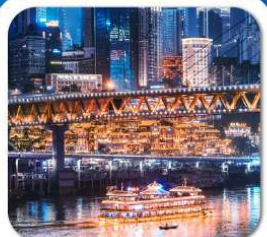
"ล่องเรือชมหงหยาดัง"