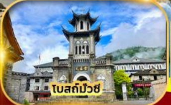
โบสถ์มัวซี