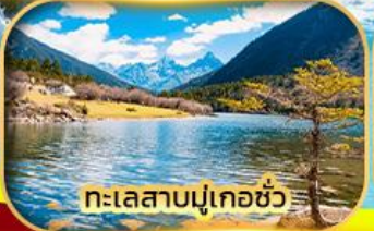
ทะเลสาบมู่เกอซัว