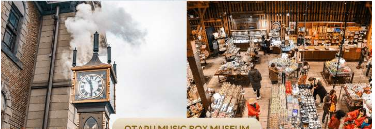
OTARU MUSIC BOX MUSEUM