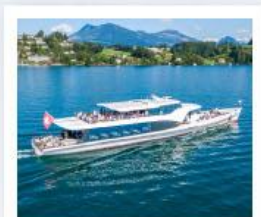
ล่องเรือทะเลสาบลูซีร์น