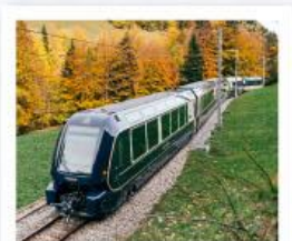
รถไฟโกลด์นพาส