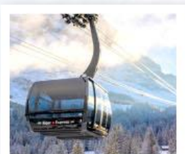
ขึ้นกระเช้ายอดเขาจุงเฟรา