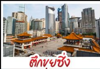
ตึกขุยซิง

พระแกะสลักหินต้าจู้ - หลุมฟ้าสะพานสวรรค์ - เขานางฟ้า ตึกขุยซิง - ตึกตะเกียบ หมู่บ้านโบราณฉือซีไห่