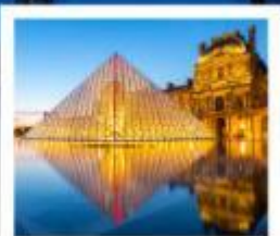
ถ่ายรูปปิพิธกัณฑ์ลูฟร์