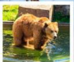
บ่อหมีเมืองเบิร์น