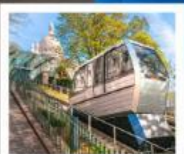
ขึ้นรถรางสู่มกราคม