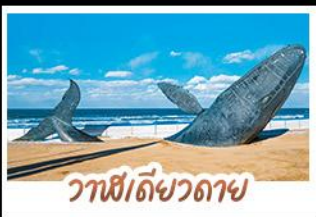
วาฬยัดขวิดตาย