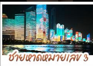
ซ่าชายหาดมาเจลเลข 3