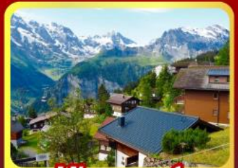
หมู่บ้านเมอร์สเรน