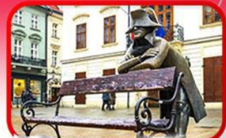
ย่านเมืองเก่าราติสลาวา

เที่ยวเมืองสวยริมทะเลสาบ ฮัลล์สตัดท์ • ชมเมืองไข่มุกแห่งโบฮีเมีย เซสกี กรุงลอน • ปราก • เวียนนา • ซอปปิงพาร์นดอร์ฟ เอาก์เล็ท