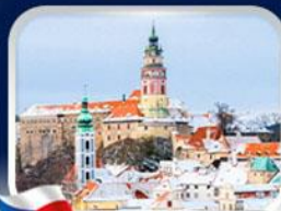
เมืองเชสกี้ กลุมอพล