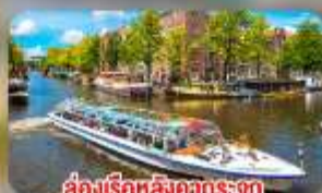
สองเรือหลังคากระจก