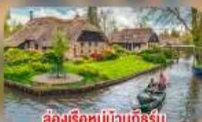
สองเรือหมู่บ้านทึร์น